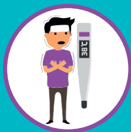
ПОВЫШЕННАЯ ТЕМПЕРАТУРА ТЕЛА