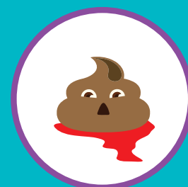
ПРИМЕСИ В КАЛЕ (СЛИЗЬ, КРОВЬ)