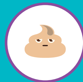
ИЗМЕНЕНИЕ ЦВЕТА КАЛА