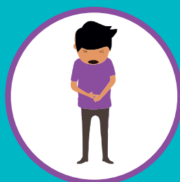
БОЛЬ В ЖИВОТЕ